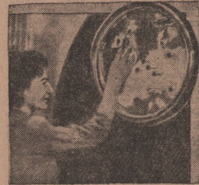
Na londyńskiej wystawie „Britain can make it” sensację budzi aparat radiowy, którego skala wykonana jest w kształcie tarczy z mapą państw europejskich. Wystarczy nacisnąć odpowiedni guziczek, by otrzymać życzoną stację. W dodatku tarcza stanowi efektowną dekorację

Dzisiaj obraz na tym odcinku przedstawia się ponuro. Statystyka wykazuje, że jeszcze dziś, w drugim roku po zakończeniu wojny, liczba zgonów przewyższa liczbę urodzeń. Jesteśmy w tej sytuacji, że zapoznaliśmy się z małym tylko stopniem starania się mu przeciwdziałać. W postawie społeczeństwa, jeżeli chodzi o zagadnienia odbudowy i wzmocnienia biologicznego naszego narodu, muszą zająć radykalne zmiany. Dziecko w Polsce musi być otoczone należną opieką. Rodzina, jako podstawowa komórka w życiu państwa, musi być uszanowana i należy jej zapewnić jak najkorzystniejsze warunki rozwoju. Państwo ma tutaj do odegrania wielką rolę. Musimy uczynić wszystko, aby Polska przestała być omentarzystkiem nieurodzonych dzieci. Musimy jak najprędzej uzyskać przewagę urodzeń nad zgonami, aby następnie stale iść naprzód i jeśli nie przewyższyć, to przynajmniej dorównać pod tym względem narodowi zdrowym. Jest to najwyższy nakaz chwili obecnej, nakaz, którym musi się zająć całe społeczeństwo polskie.