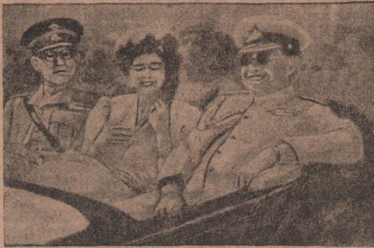
Zdjęcie z defilady, jaka odbyła się w Atenach po powrocie króla greckiego z Anglii. Obok króla (po lewej) widzimy następcę tronu księcia Pawła i księżniczkę Frederikę.