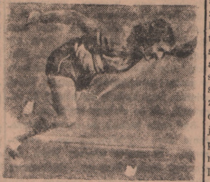
Podczas kiedy doskonała sportsmenka francuska — Colchen zdobyła mistrzostwo Europy w skoku wżwyż uzyskując wysokość 1,60 m, inna zawodniczka francuska — Claire Bresolle (na zdjęciu) uplasowała się na trzecim miejscu w finale biegu na 100 m uzyskując czas 12,2 sek.

Notujemy przede wszystkim nie zwykłe zainteresowanie się spor-