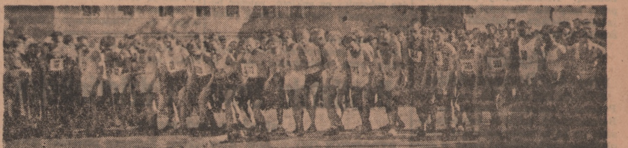
Uczestnicy biegu KS „Grafika” na starcie.

BYDGOSZCZ. Tutejszy KS „Grafika” zorganizował bieg na przełaj im. Janusza Kusocińskiego. Na starcie stanęło blisko 200 zawodników, pochodzących z terenu prawie całej Polski. W konkurencji seniorów zwycięstwo odniósł Wasilewski (RKS Włocławek), uzyskując na trasie ok. 3,500 m czas 9,56, drugie miejsce zajął zeszłoroczny zwycięzca w tym biegu — Dzwonkowski (Zryw Włocławek), trzecie Kielas (Gedania — Gdańsk).