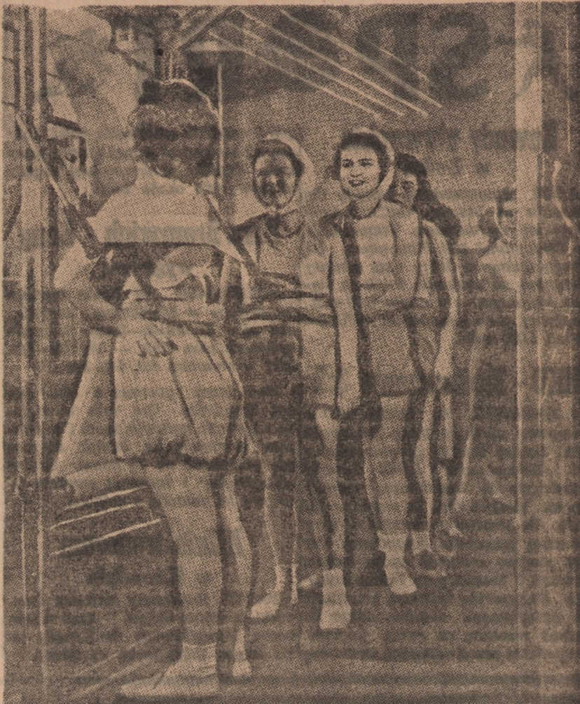
Największym wrogiem ludzkości jest niewątpliwie gruźlica. Walczą z nią uczeni całego świata, lecz, niestety, gdy tylko procent chorych zaczyna się zmniejszać, wojna niszczy dorobek ludzkich wysiłków podnosząc cyfrę chorych o nowe miliony. Obecnie obok zwalczania samej choroby, medycyna stosuje środki zapobiegawcze. O to skutecznie czekają na swą kolejkę do prześwietlenia. Zdjęcie takie, dokonane przy pomocy najnowszych aparatów, pozwala na wydatne nieulegającej wrażliwości diagnozy

W roku przyszyłym czeka nas nie tylko kontynuowanie rozpoczętej pracy nad odbudową życia gospodarczego, ale i zwiększenie wysiłków w tym kierunku. Z tych m. in. względów pełne poparcie dla Daniny Narodowej, która przeznaczona została w całości na zagospodarowanie Ziemi Odzyskanych jest naszym obowiązkiem.