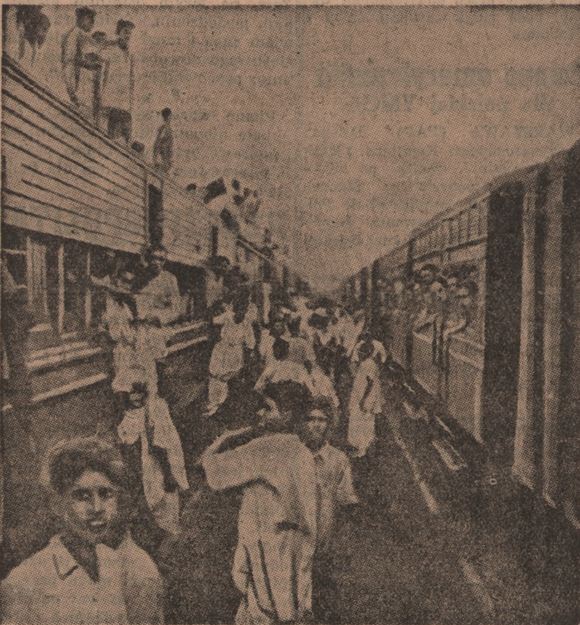
Na zdjęciu pociąg przepelniony uchodźcami z terenów krwawych rozruchów między członkami Ligi Muzułmańskiej a zwolennikami hinduskiej Partii Kongresowej — we wschodnim Bengalu. Po prawej pociąg żołnierzy brytyjskich, wracających po odbytej służbie do Anglii

NOWY JORK (PAP). Spod gruzów budynku, który się zawalił wskutek eksplozji na wyspie Manhattan, wydobyto zwłoki dalszych 24 osób. Nie ma już żadnej nadziei na uratowanie 12 osób, zaspanych pod gruzami budynku.