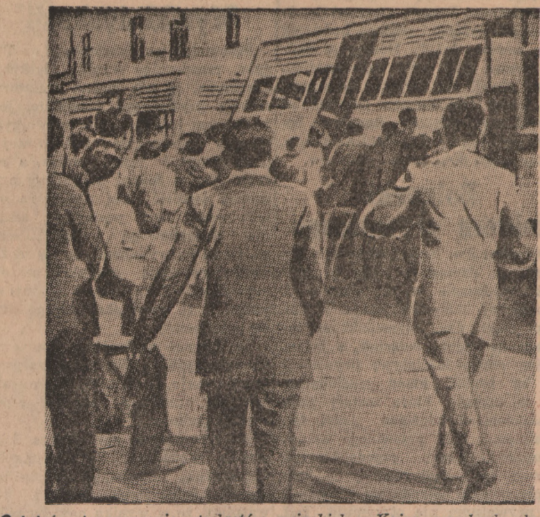
Ostatnie demonstracje studentów egipskich w Kairze przybrały charakter ogólnej rewolty. Tłum poprzewracał wozy tramwajowe i wytlukił kamieniami wszystkie okna dwu reprezentacyjnych hoteli angielskich. W kilku okręgach miasta policja otworzyła ogień. Rozruchy były protestem przeciwko pertraktacjom Sidki Paszy z rządem angielskim i stały się m.in. przyczyną ustąpienia premiera. Wśród wrogich okrzyków wznoszonych przez demonstrantów powtarzały się słowa: „Precz z Sidki Paszą! Precz z Bevinem!”