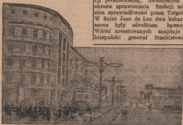
Stalingrad — jedno z najbardziej zniszczonych przez Niemców miast Zw. Radzieckiego — odbudowuje się. Zdjęcie nasze przedstawia odbudowaną ulicę pięknego nadwołżańskiego miasta.