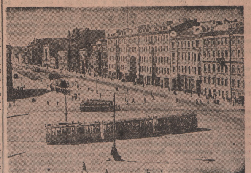
Ulica Ligowska, jedna z najdłuższych ulic w Leningradzie