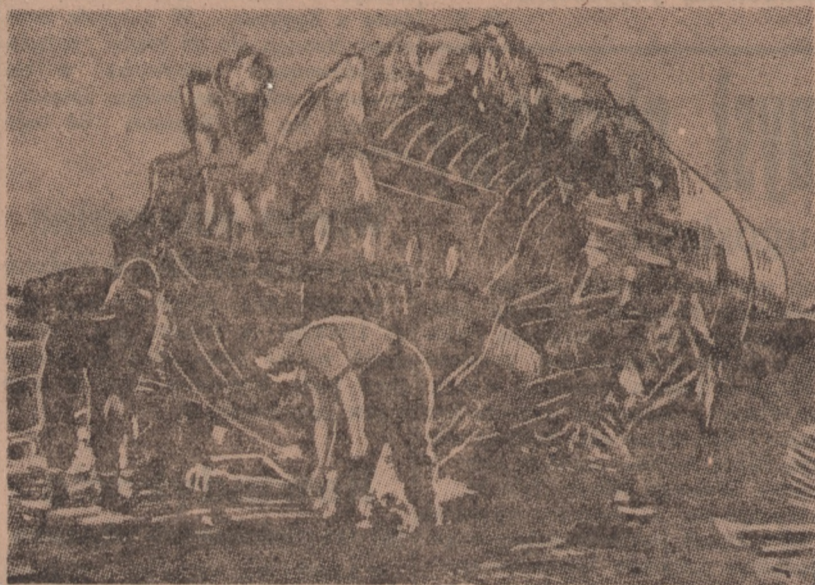
Szczątki pieknego liniowca powietrznego rozrzucone zostały na znacznej przestrzeni. Na zdjęciu część rozzerwanego kadłuba, w którego okolicy i pod którego szczątkami znaleziono zwłoki dwunastu zabitych członków załogi i pasażerów

Katastrofa „Trans-World-Airline-Constellation“ Bohaterstwo młodej zarządczyni baru pokładowego Wśród zabitych są Polacy — Z brudnych wód rzeki Shannon wyłowiono ocalałe w katastrofie dziecko — Akcję ratunkową utrudniało sięgające po kolana bagno — Potworny bilans 4 miesiące