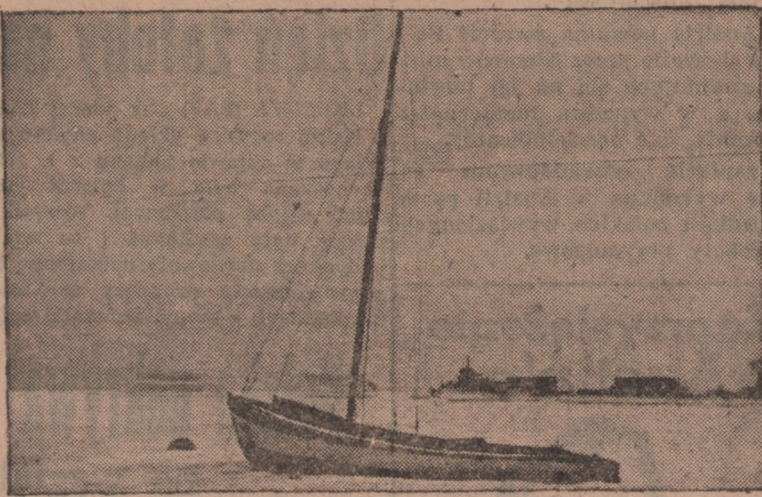
Silne mrozy, jakie ostatnio panowały również na Wybrzeżu, pokryły powłoką lodową baseny portowe. Widok na Basen Jachtowy w Gdyni.