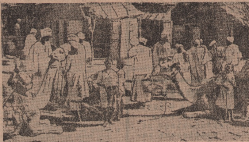
Malownicza scena z targu na rynku w miejscowości Ondurman w Sudanie.

Syn handlarza drzewem przewodzi największej partii Egiptu — „Młody Egipt“ — Bractwo Muzułmańskie pragnie wskrzesić Islam