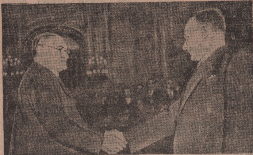
Wyrazem szczerej współpracy brytyjsko-radzieckiej na specjalnej konferencji poświęconej traktatowi z Niemcami jest serdeczny uścisk dłoni, który wymieniają członkowie Rady Ministrów Spraw Zagraniczym, Bevin (Anglia) i Gusiew (ZSRR).