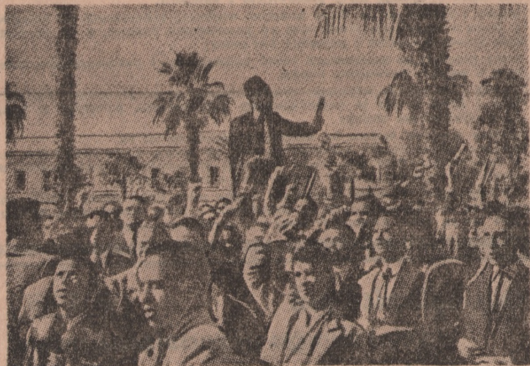
Studenci egipscy demonstrują przeciwko zawarciu umowy angielsko-egipskiej. (Zdjęcia dokonano w grudniu ub. roku).

Nawiązując do sprawy dopuszczenia Partii Socjaldemokratycznej w strefie sowieckiej, Grotewohl powiedział, że doprowadziły to tylko do rozbicia w społeczeństwie i wyszłyby na jego niekorzyść.