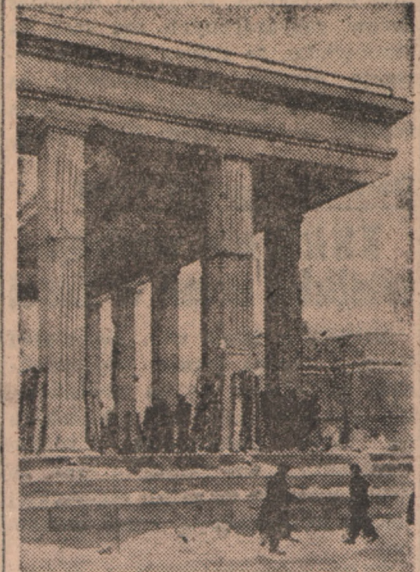
Nakazem niszczenia pomników militarnych niemieckich i buty pruskiej objęte zostało również słynne mauzoleum hitlerowskie w Monachium, wzniesione tu czci uczestników puczu Hitlera z roku 1923. Na zdjęciu — z prawej — mauzoleum po wybuchu ładunku dynamitu.