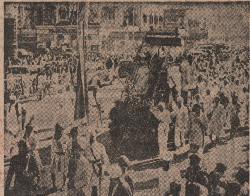
Kalkutta stała się w ogólnym pojęciu symbolem miasta, którego ulicami bezustannie płynie krew. Mieszkańcy Kalkuty przeżywają jednak także i dni pełne wznieślich wzruszeń. Jednym z takich dni, to rocznica urodzin Guru Goving Singh — wielkiego go sahiba. W dniu tym w ceremonialnej procesji przewozi się główną ulicą miasta „Świątą Keigę”. W procesji uczestniczą tysiące hinduskich mężczyzn, kobiet i dzieci.