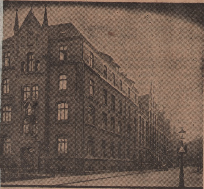
Szpital Sióstr Elzbietanek w Poznaniu przy ul. Łąkowej

nie z lekarzami, zastrzykami, innymi aparatami do nagrzewania, czy też „soplówkami”.