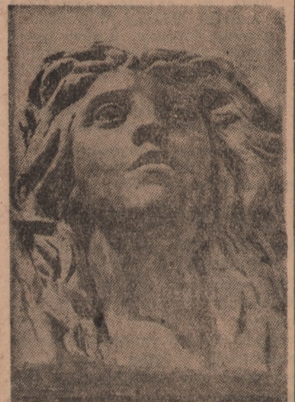
Fragment projektowanego pomnika ku czci bojowników getta w Warszawie

widmo zbiorowej odpowiedzialności oraz piorunujące tempo akcji niemieckiej, które udaremniło jakąkolwiek inicjatywę. Ogół zresztą, otumaniony kłamliwą propagandą niemiecką, nie wierzył w fizyczną zagładę i uważał, że jeśli będzie dostarczony kontyngent na wysiedlenie, reszta getta zostanie na miejscu. Bojowcom zaś uniemożliwił walkę na większą skalę dotkliwy brak broni i amunicji. 28 lipca 1942 r. w czasie pierwszej akcji wysiedleńczej utworzono Żydowską Organizację Bojową. Kolportowano nielegalne odezwy, w których nawoływano do biernego i czynnego oporu. Rozdawano tysiącami ludzi w czasie akcji fałszywane „zaświadczenia pracy”. Wzniesiono pożary dywersyjne w blokach, opuszczonych przez Żydów, skąd Niemcy wywozili zagrabione mąjki. Żydowska Organizacja Bojowa oddała swoje pierwsze strzały do Niemców. Następnego dnia otrzymano pierwszą pomoc od Gwardii Ludowej 9 rewolwerów i 5 granatów ręcz-