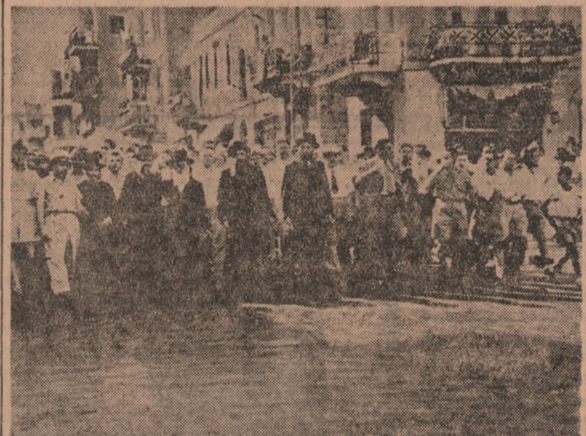
Oto jedna z licznych manifestacji żydowskich na ulicach Haify. Z rabinami na czele Żydzi demonstrują przeciw niedopuszczeniu do Palestyny nielegalnych imigrantów