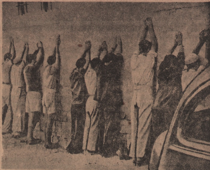
Po ostatnich zamachach bombowych w Jerozolimie, Anglicy zastosowali ostre represje. Na zdjęciu grupa Żydów, podejrzanych o dokonanie jednego z zamachów w Jerozolimie. Ustawili twarz do ściany, czekając na wynik dochodzeń

skiej i Zamenhofs, gdzie ginie dużo bojowców żydowskich. Tutaj grupa bojowa wyprowadzona z Milej 64 rzuciła się na eskortę niemiecką i rozbroiła ją. Dochodzi też do większych starć w domach: Zamenhofs 40 i 56, Muranowska 44, Miła 34, 41 i 68, Franciszkańska 22. Ze względu na niespodziewany opór Niemcy widzieli się zmuszeni przerwać akcję. Ogółem w wyniku walk zdobyto kilka karabinów ręcznych i maszynowych; zabito względnie zraniono 50 Niemców. Odtąd idea walki stała się w getcie popularna. W tych warunkach styczniowy zbrojny odruch, choć nikły jeszcze rozmiarami, urosł do znaczenia symbolu, był wstępem do kwietniowego powstania w getcie.