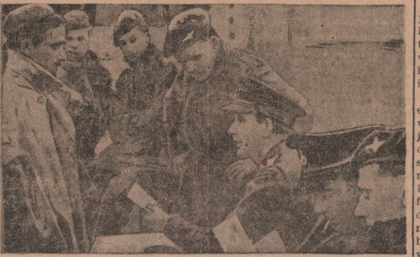
W poszukiwaniu terrorystów żydowskich, którzy wychłostał brytyjskiego oficera i trzech sierżantów sztabowych, władze brytyjskie przestuchały ponad 2.500 osób. Ceterdziesięciu Żydów zostało zatrzymanych dla dalszych dochodzeń. Na zdjęciu sceny z rewizji i przesłuchiwania podejrzanych