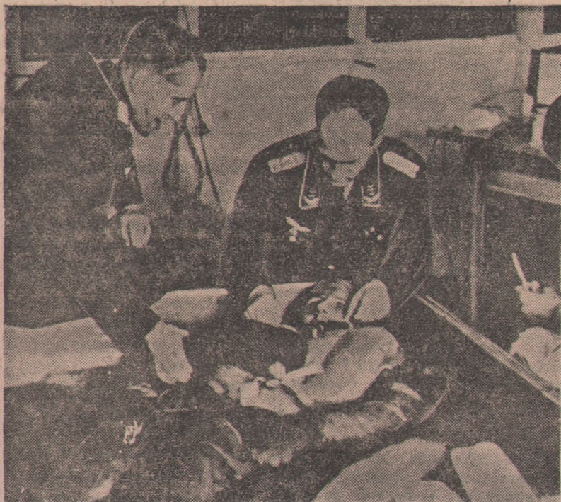
Swyrodniali lekarze SS dokonywali doświadczeń na żywych ludziach w warunkach kwalifikujących te eksperymenty do zbrodni. (Petersen, 1947, s. 1-10)