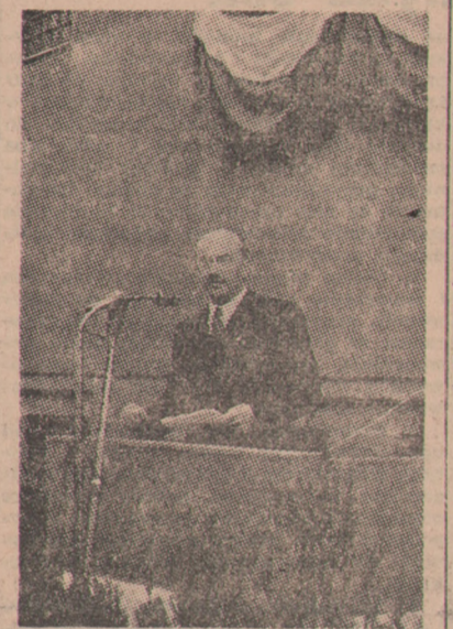
Premier ministrów Nagy Ferenc mówi o polskich bohaterach.