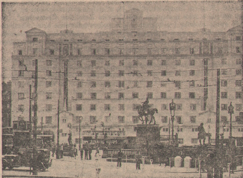
Śródmieście miasta Leeds, zwanego miastem stu fabryk