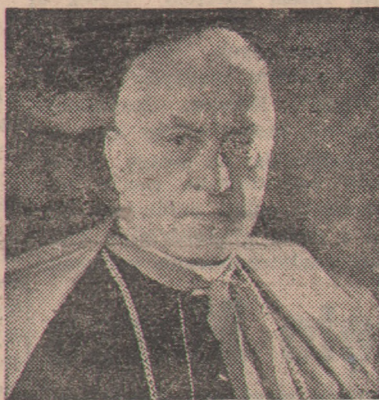
J. E. X. kard. A. Hlond

W tej myśli składamy hołd Dostojnym Gościom.