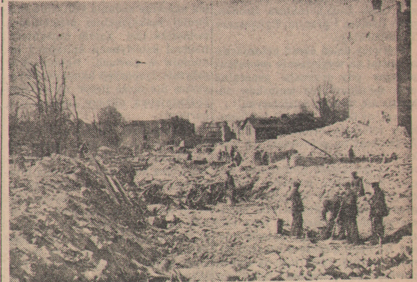
W Gdańsku prowadzone są intensywne prace nad poszerzeniem i przebudową arterii przelotowej, łączącej Gdańsk z Gdynią. Na miejscu spalonych domów powstanie szeroka, jednokierunkowa jezdnia, która nada ul. Grunwaldzkiej nowoczesny charakter