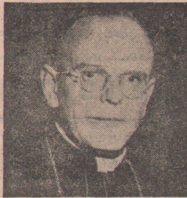
J. E. X. kard. B. Griffin

Ich Em. Ks. Kard. dr B. Griffina i dr A. Hlonda