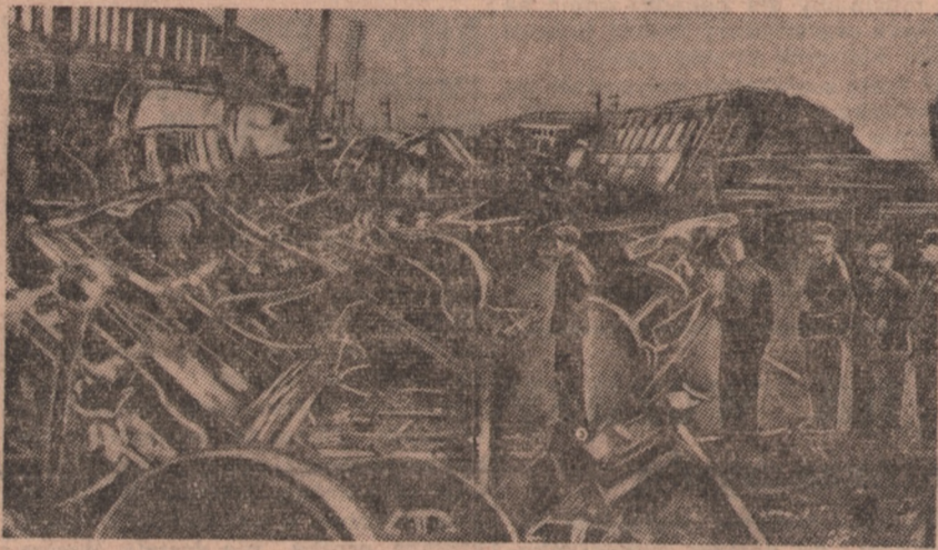
W środkowej Anglii pod Doncaster zderzyły się w pełnym biegu dwa pociągi dalekobieżne. Skutki katastrofy były straszne: 17 zabitych i 70 rannych. O rozmiarach katastrofy świadczą zdjęcia, pokazujące strzaskane wagony rozrzucone wzdłuż toru.