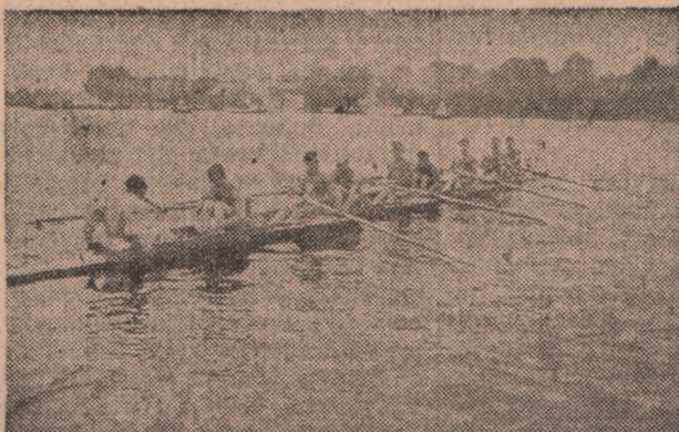
„Niemiecka ósemka” AZS-u podczas treningu na torze regatowym w Grünau pod Berlinem.

Nazajutrz po regatach, w których na 8 załóg zagranicznych tylko Polacy odnieśli zwycięstwo, wszystkie niemieckie dzienniki sportowe i nie-