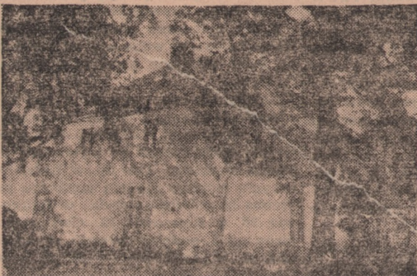
Dworek w Bendominie pod Kościerzyną, w którym urodził się dnia 29. IX. 1747 roku gen. Józef Wybicki.