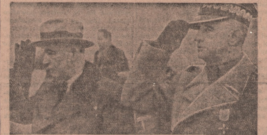
Gen. Sikorski doskonale oceniał znaczenie wspólnoty interesów państw słowiańskich i starał się nawet na emigracji podczas ostatniej wojny utrzymać jak najserdeczniejsze więzy przyjaźni z czołowymi osobistościami państw słowiańskich. Nasze historyczne zdjęcie przedstawia gen. Sikorskiego wraz z prez. Beneszem w chwili odbierania defilady oddziałów wojskowych w Londynie.

Paryż, w październiku Pismo francuskie „Ce Matin” wydrukowało szereg rewelacyjnych sprawozdań z rozmowy z Ottonem Skorzenym, głośnym z wyprawy Grand Sasso, skąd na polecenie Hitlera wykradł i uwolnił więzionego tam Mussoliniego. Wyczyn ten był w swoim czasie bardzo głośny, a jak się obecnie okazuje, Otton Skorzeny, wsławiony wyprawą na Grand Sasso, niemal od początku ostatniej wojny był przeznaczony do specjalnych zadań. Jemu, jak się dowiadujemy z rewelacji „Ce Matin”, powierzona została m. in. misja zamordowania de Gaulle'a. Ale posłuchajmy, co na ten temat pisze „Ce Matin”: