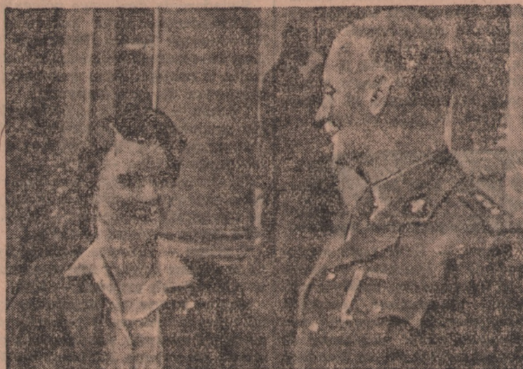
Jedno z ostatnich zdjęć gen. Sikorskiego z córką. Oboje oni zginęli w katastrofie lotniczej nad Gibraltarzem.

Wymowny jest fakt, że polski agent podsuł już kilka roku przed tym bomby do samolotu Sikorskiego i że główni umundurowani wrogowie