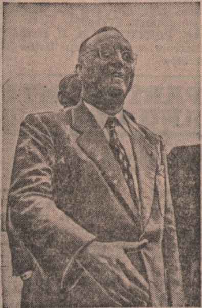
Wysoki komisarz Francji w Indochinach — Bollaert wygłosił w Hadong (Tonkin) przemówienie, w którym zaapelował do wszystkich ster politycznych, kulturalnych i społecznych aby przyczyniły się do przywrócenia pokoju w Indochinach. Czy apel jego odniesie zamierzony skutek?