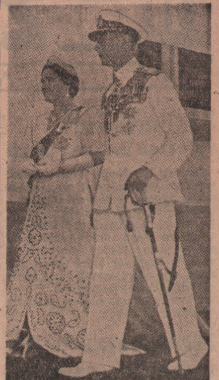
Rodzice młodej panny król Jerzy VI i królowa Elżbieta

Na przyjęciu wydanym we wtorek dla zaproszonych gości w pałacu Buckingham, podczas którego wszyscy obecni mieli okazję obejrzenia podarunków ślubnych, księżniczka wystąpiła w tiulowej sukience koronkowej i naszyjniku złożonym z 21 brylantów, ofiarowanym jej przez Unię Południowo-Afrykańską w kwietniu bieżącego roku. Dwa dziesiąta spośród 25 nadesłanych sukien z amerykańskich domów mody, księżniczka postanowiła podzielić między swoje rówieśniczki, których ślub odbywa się w dniach 19, 20 i 21 listopada br.