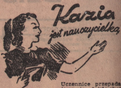
Uczennice przepadają za nią. Jakże chętnie słuchają jej lekcji i patrzą na jej zawsze młodą doskonale utrzymaną twarz. A przecież nie ma tam śladu używania kosmetyków — jedynym środkiem, który utrzymuje jej cerę zawsze świeżą to krem matowy i puder „Anida”. 01669