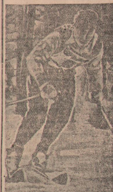
Wśród narciarzy, którzy wzięli udział w tegorocznej Olimpiadzie zimowej w St. Moritz, wyróżnił się Francuz Henri Oreiller, doskonały zwiastca w zjazdach. Stąd też sportowcy francuscy rokuja mu nowe, poważne sukcesy na przyszłość.