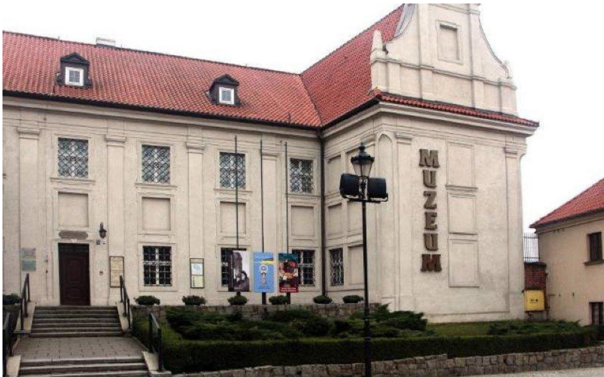
Gmach główny Muzeum w Grudziądzu.