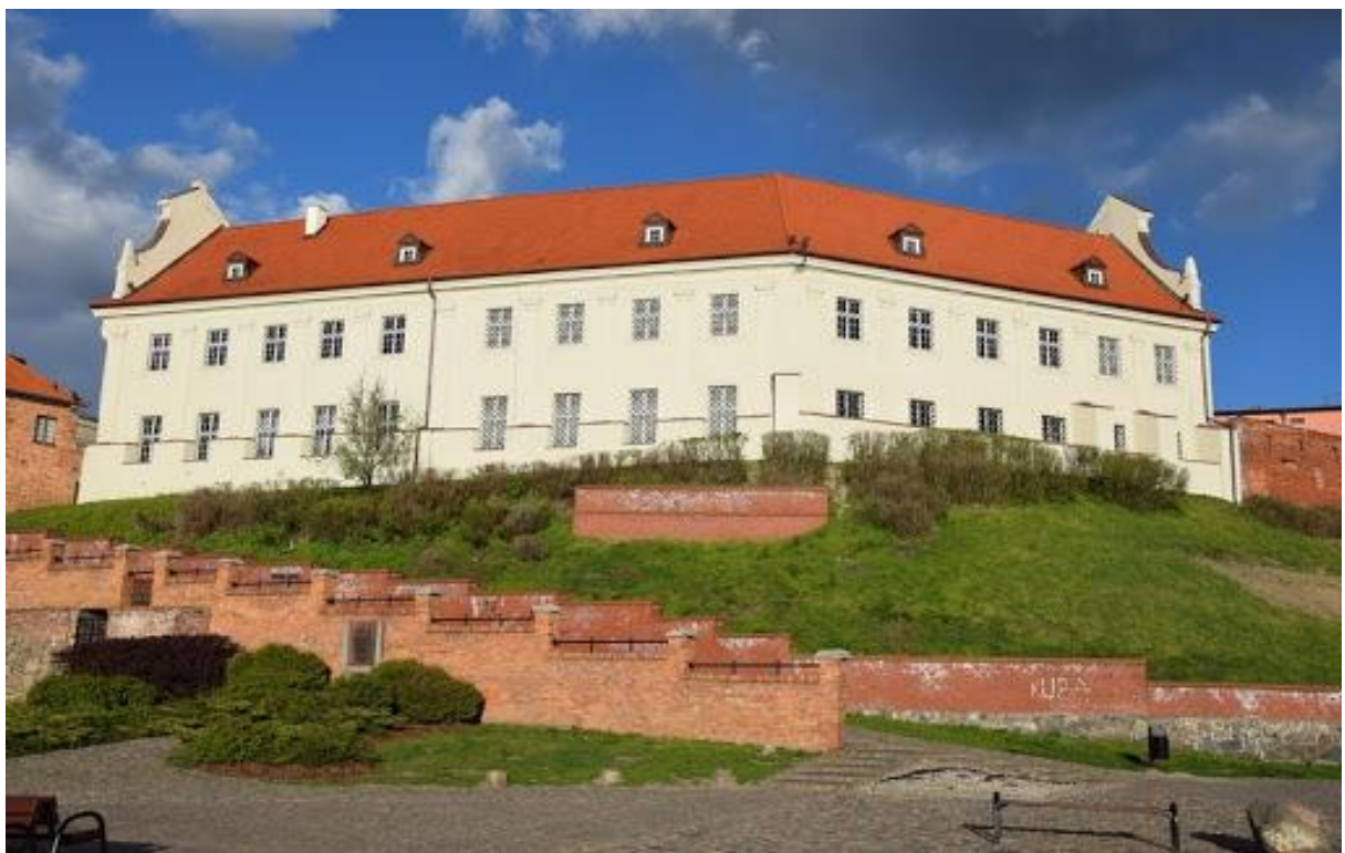
Muzeum w Grudziądzu od strony Wisły.