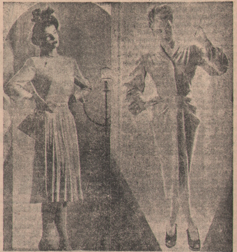
Oba fasony są modne, ale jakże bardzo różniące się krojem. Skromna sukienka z leciutkiej welny — spódnica układana we fałdy, długie rękawy, zupełnie bez dekolty. Druga natomiast — to model ogromnie lansowany przez Paryż, poszerzający biodra. Jest to jednak model tylko dla szczupłych i wysokich pań!

Na straży urody i młodości ALADYN Kosmetyki najwyższej jakości żądać wszędzie TORUŃ