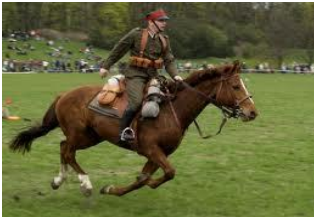
Ułan podczas pokazów na zjeździe kawaleryjskim w Grudziądzu.

dzone są strony internetowe: www.cwk.grudziadz.pl , opracowuje się kwerendy. Fundacja na Rzecz Tradycji Jazdy Polskiej jest organizacją pozarządową non profit.