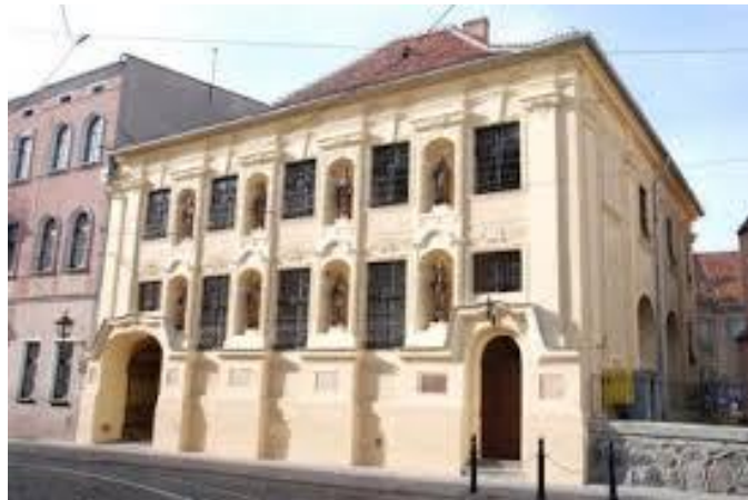
Pałac Opatok, część Muzeum im. ks. dra Wł. Łęgi w Grudziądzu, w której znajdują się sale wystawowe poświęcone kawalerii.