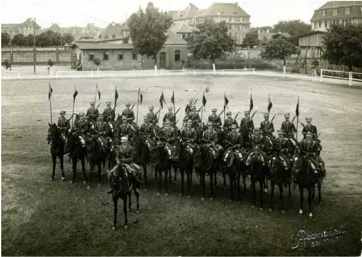
Ułani w przedwojennym Grudziądzu.