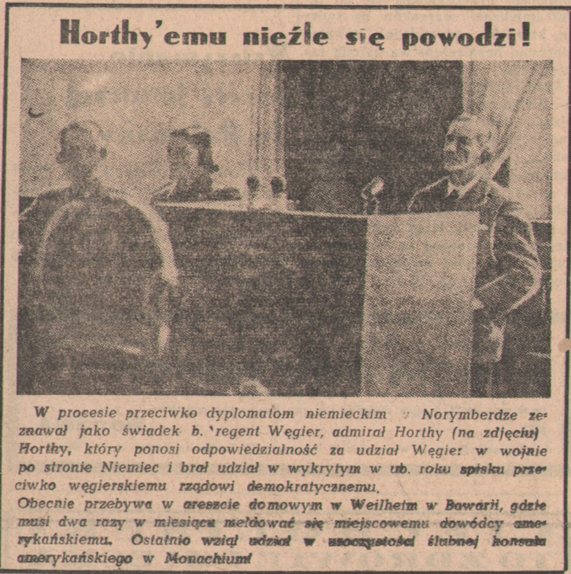
Horthy'emu nieźle się powodzi!

na podjęcie rozmów w sprawie poprawy stosunków radziecko-amerykańskich