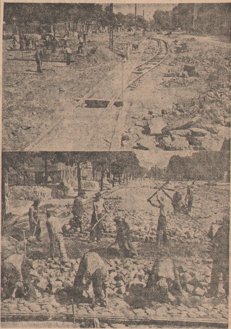
Ulica Grunwaldzka w Bydgoszczy po kapitalnej przebudowie stanowić będzie główną arterię tranzytową łączącą wschód z zachodem. Przystąpiło do poszerzenia kosztem 7 mil. zł głównej jezdni, przełożenia chodników, założenia zieleńców i specjalnych dróg dla ruchu kołowego. Do końca września br. mają być prace na z góry określonym odcinku definitywnie ukończone.