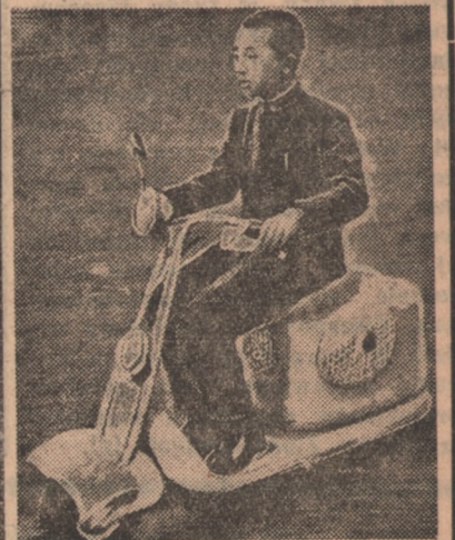
Syn cesarza japońskiego wychowywany jest na sposób europejski. Ten nowoczesny motocykl (... być może подарunek niekorowanego króla Japonii — Mac Arthura) stał się najmilszą rozrywką młodego księcia Akihito.