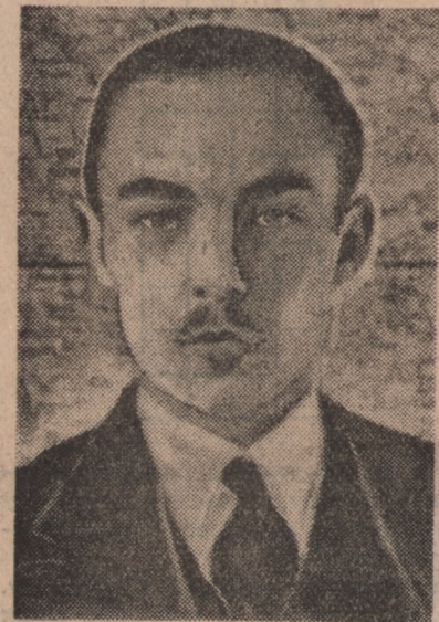
Hrabia Paryża, zwany Henrykiem V, pretendent do tronu francuskiego.

Wiadomo, że nie jedziemy do Londynu po laury z wyjątkiem zwycięzcy w olimpijskim konkursie muzycznym — Turckiego. Jeżeli więc posyłamy do Londynu tylko 23 zawodników na ogólną cyfrę 46 uczestników wyprawy, to może by jeszcze ograniczyć liczbę tych co mają zmierzyć swe siły i wyniki sportowe z najlepszymi sportowcami świata, a raczej postać więcej jeszcze osobowości oficjalnych, które będą brały udział w zjazdach, obradach itp. oraz będą zbierały cenne doświadczenia potrzebne na przyszłą Olimpiadę, na którą może na 100 już członków ekipy, pojedzie 90 oficjellów?