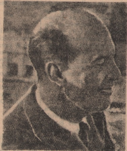
Humbert, były król włoski. Kłóżył się z tym łysym jegomościem dawnego ulubieńca kobiet włoskich?

Najsmutniej wygląda Casa do Baluarte, kilka kilometrów od Lizbony, zamieszkała przez b. króla Włoch, Humberta II. Ostatnie ciężkie przejścia wyrzyły na nim swe piętno. Ojciec umarł, żona zagrożona ślepotą i nie odzyskująca zdrowia po przedwczesnym porodzie, ukochany synek z ledwo podległą gruźlicą gruźliczką, tron bezpowrotnie utraconej. — Nic też dziwnego,