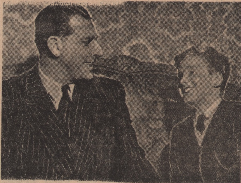
Juan III Bourbon, pretendent do tronu Hiszpanii, z synem Juanito.

Jak bardzo dokuczyły Portugalczynom monarchia i jej dynastia, dowodzi stały pobyt na przedmieściach Lizbony pretendenta do tronu Don Duarte Di Braganza, następcy ostatniego króla Portugalii, Emanuela, który zrujnował skarb państwa swą rozrzutnością i życiem nad stan, a w końcu uciekł, wypędzony przez rozjuszone tłum głodnych robotników, do Londynu (1910), gdzie zmarł w ogólnym zapomnieniu. Don Duarte nie odziedziczył po Emanu-