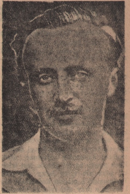
Don Duarte di Braganza, nieszkodliwy dla Portugalii pretendent do jej tronu.

Spotkałem niedługo na szerokim świecie pewnego Polaka, który ka-