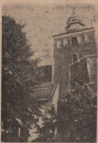
Potęna wieża gotyckiej Fary przytłacza swym ogromem.