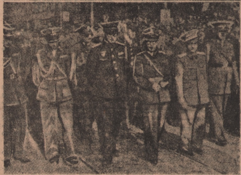
Nasze zdjęcia przedstawiają fragmenty śródowych uroczystości pogrzebowych w Pradze. U góry: kondukt pogrzebowy na ulicach Pragi. U dołu: Attache wojskowi akredytowani w Pradze, wśród nich również oficerowie polscy, za trumną zmarłego b. prezydenta Czechosłowacji.