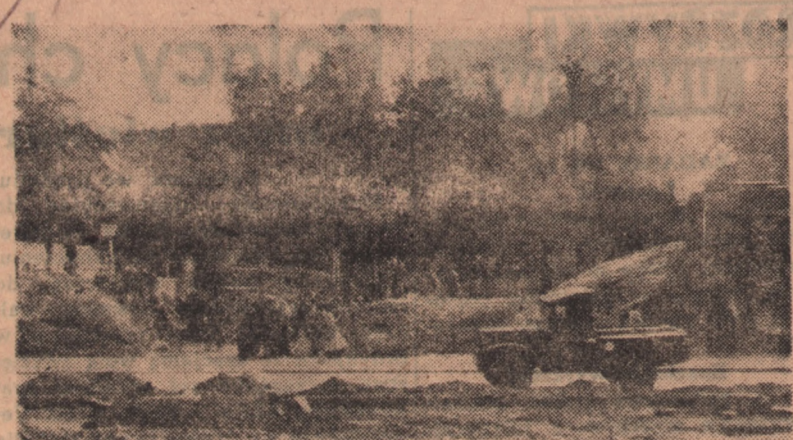
Fragment prac nad odsłonięciem zamku Przemysława, który w niedługim czasie zostanie odbudowany