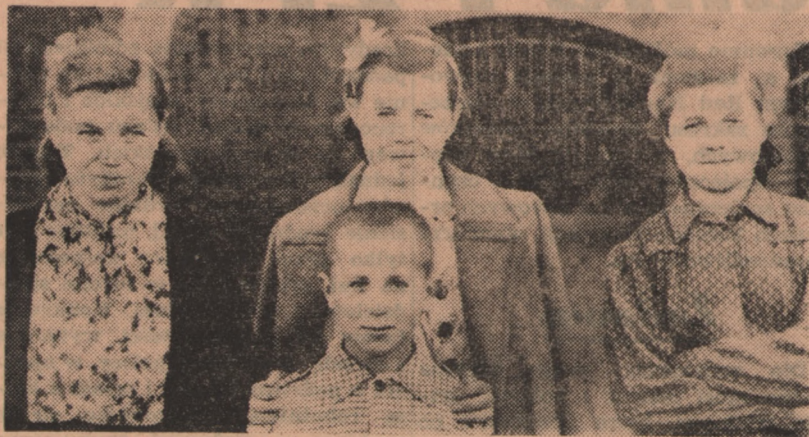
Na zdjęciu: Czworo rodzeństwa Chłopców, pełne sieroty przebywające w Miejskim Domu Dziecka w Bydgoszczy.

(dr) Po raz czwarty od zakończenia najstraszniejszej w skutkach wojny, zwraca się Komitet Uczczenia Ofiar Zbrodni Hitlerowskich do społeczeństwa z prośbą o pamięć o tych, których wojna najgorzej dotknęła, zabierając im jedynych żywicieli. Zaciągaliśmy wobec nich dług. Przez ich cierpienia bowiem i śmierć cieszymy się dzisiaj wolnością, cieszymy się, iż możemy urządzać życie według własnych praw na naszej ziemi. Ale żyją między nami wdowy i sieroty po tych bohaterach i im winimy spłacić największy z długów, bo dług wdzięczności. Nadchodzi Boże Narodzenie. Niech razem z nami radują się sieroty ofiar wojennych!