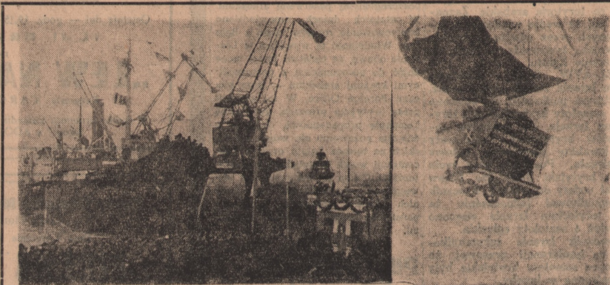
W tych dniach załadowano w porcie gdańskim 25-milionową tonę węgla wyeksportowanego przez Polskę za granicę. Jubileuszową tonę zabrał szwedzki statek „Halmstad”. Ostatni wagon węgla przybył z kopalni „Karol”. W porcie odbyła się z tej okazji uroczystość z udziałem licznie zgromadzonej publiczności. Na zdjęciu dźwig przetrzuca węgiel — zamykając rachunek: 25 milionów ton.

W konkluzji przedstawiciel ZSRR wniósł następujące propozycje: liczebność policji japońskiej należy ograniczyć do 125 tysięcy oraz zakazać jakiegokolwiek zwiększania tej liczby i wzmocnienia uzbrojenia policji aż do czasu zawarcia traktatu pokojowego z Japonią. Wszystkie tajne organizacje policyjne w Japonii należy rozwiązać.