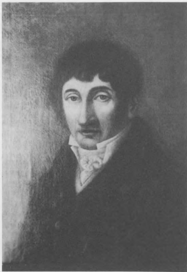
Samuel Bogumił Linde (portret w zbiorach Książnicy Miejskiej)

za które najprawdopodobniej otrzymywał wynagrodzenie. Być może zlecane zadania sprawiły, że podróżował do Drezna. Tam zetknął się z Franzem Volkmarem Reinhardem, głównym kaznodzieją dworskim, który poznawszy jego zainteresowanie językiem i literaturą polską, stwierdził, że język ten jest trudny, a w literaturze nie ma niczego oryginalnego. Linde nie zapomniał tych słów. Przypomnił je po latach w przedmowie do swego przekładu pracy Józefa Maksymiliana Ossolińskiego o Wincentym Kadłubku.