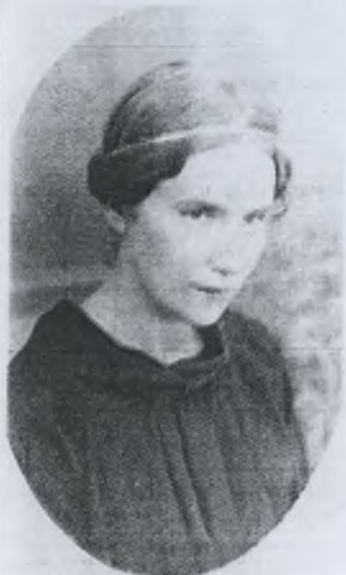
Helena - studentka uniwersytetu w Berlinie, rok 1918