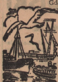
Gdańsk, w kwietniu.

Czteroletni dorobek nasz na Wybrzeżu polskim stanowi swego rodzaju epokę, w której mieści się wysiłek robotnika około odbudowy portów. Porty działają już niezwykle sprawnie. Na odzyskanym Wybrzeżu mamy ogółem 8 portów handlowych, spośród których nie uruchomiliśmy dotychczas Elbląga.