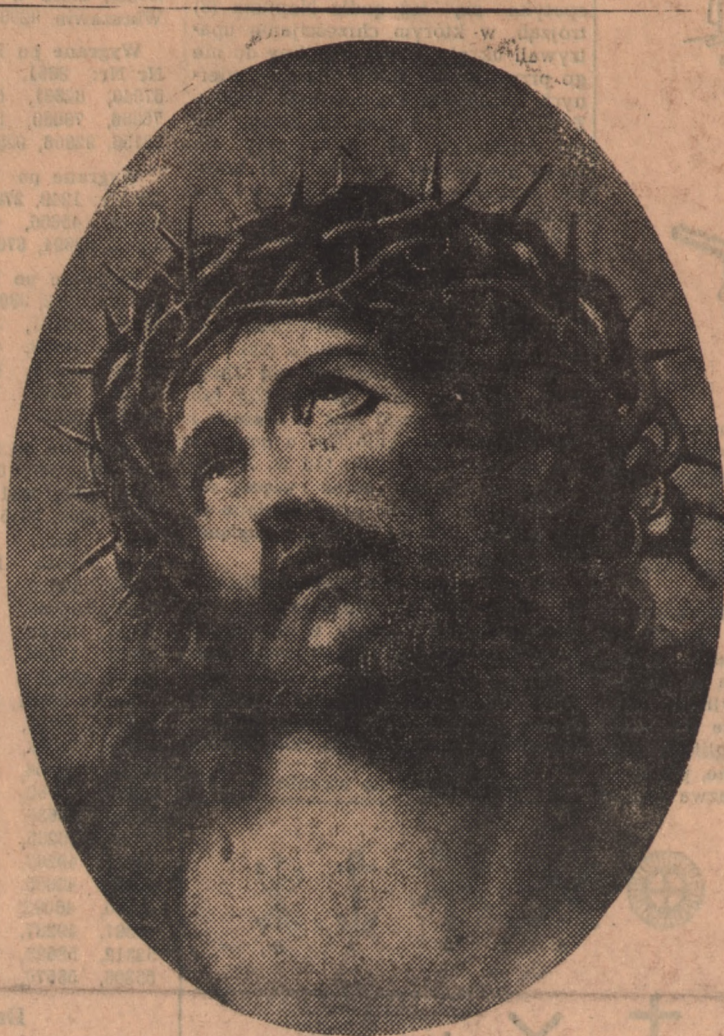
Guido Reni: Ecce Homo

Z drugiej strony zastosowanie energii atomowej dla celów pokojowych miałyby decydujące znaczenie dla podniesienia powszechnego dobrobytu.