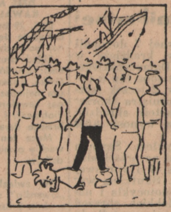
Wstyd do domu będzie wrócić. Nie widziawszy morskiej fali. Ale zamiast tu się smucić. Znowu coś skombinowali.