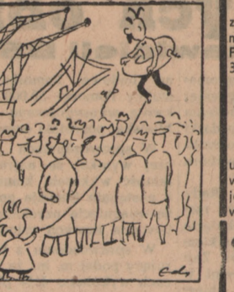
Z takim kołem ratunkowym. Ojciec w tłumie nie utonie. Frują w górę ponad głowy i zobaczą morskie tony