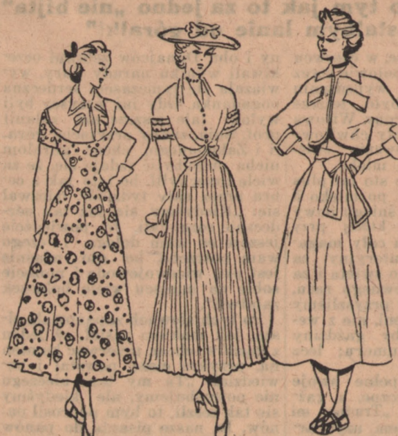
bolerka, takiego np. jak na naszym zdjęciu. Modele: Księgarnia N. Gieryn, Bydgoszcz, ul. Gen. Stałina 2a

ność wyjazdu na wczasy, wysłania dzieci na kolonie itp. Egoistyczne stanowisko jest błędem. Chcąc uniknąć konieczności wypełnienia drobnych obowiązków, tracimy wiele praw. Racjonalizacja gospodarstwa domowego, umiędzejniane zaplanowanie zajęć pozwoli nam na wzięcie udziału w życiu społecznym. Korzyści z tego są nieocenione — kontakt ze światem i aktualnymi sprawami, wzrost kultury umysłowej, poczucie zadowolenia, które towarzyszy dobrze wypełnionemu obowiązkowi, radość, że możemy pełnić tak ważną pracę. (St. H.)