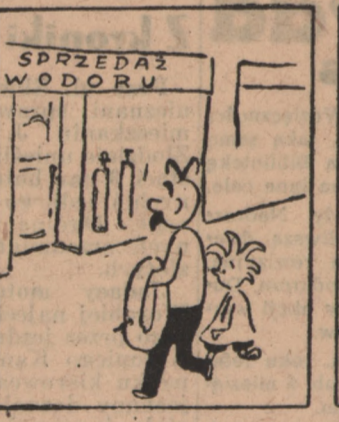
Z takim kołem ratunkowym. Ojciec w tłumie nie utonie. Frują w górę ponad głowy i zobaczą morskie tony