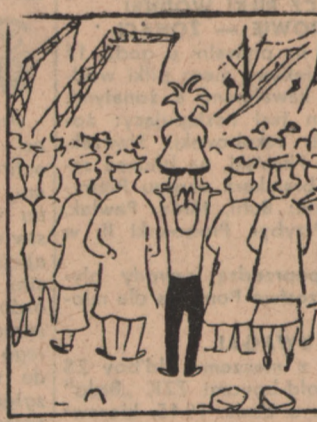
Morza nie ma, tam pół dźwigu. Nic w ogóle nie rozumiem. Oto dola jest Furdygów... Tak po prostu giną w tłumie.