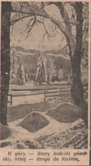
U góry — Stary kościół górski; niżej — droga do Kuźnie.