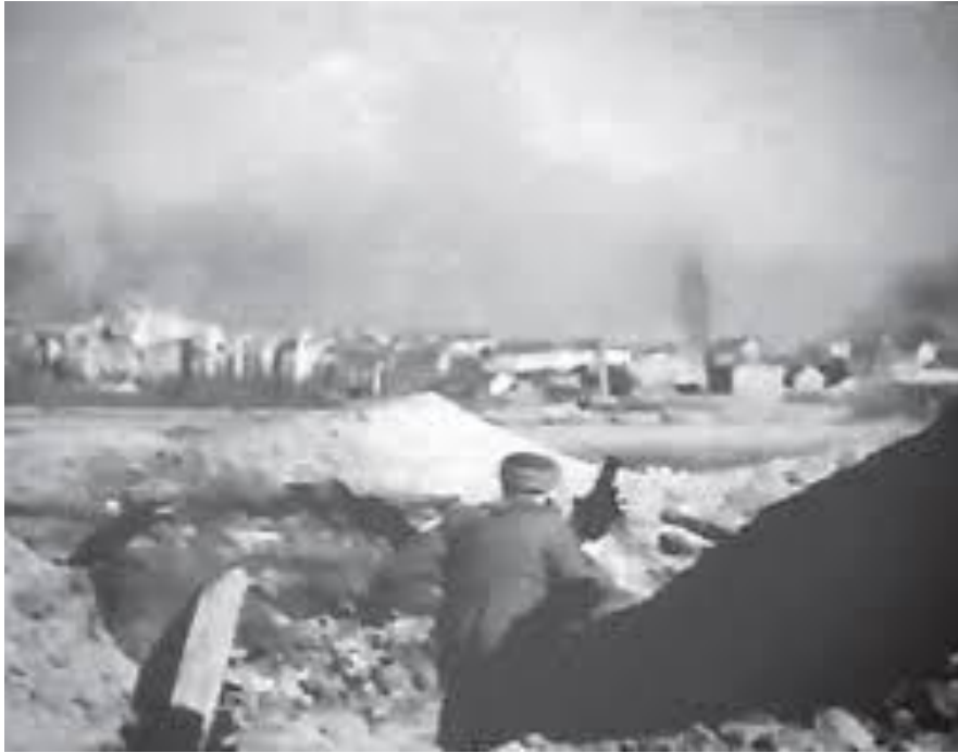
Kadr z filmu o wyzwoleniu Grudziądza. Domena publiczna.

19.2.1945 r. Rosjanie zdobywają Parski, Male i Wielkie Tarpno, Węgrowa i Gać.