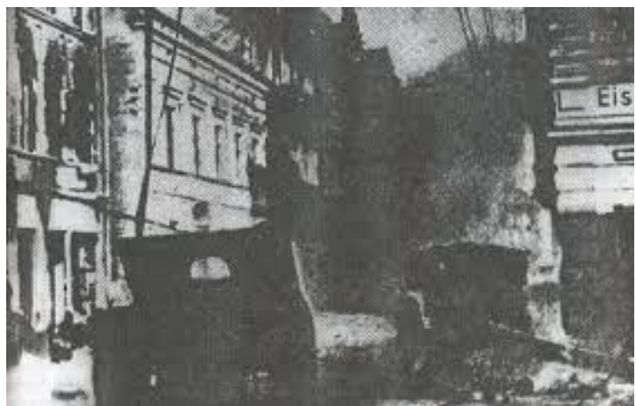
Działa na ul. Toruńskiej, kadr z filmu o wyzwoleniu Grudziądza. Domena publiczna.