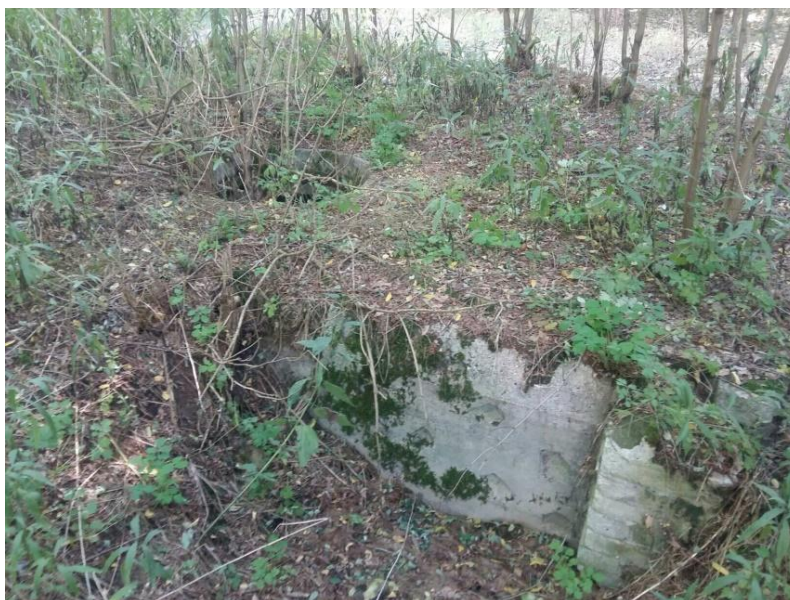
Schron Tobruk przy „dzikiej plaży”.

W październiku 1944 r. przystąpiono do budowy umocnień. Dookoła miasta wybudowano rów przeciwczołgowy, wiele kilometrów okopów. Do budowywano schrony do istniejących umocnień z czasów I Wojny Światowej. Powstało m.in. ponad 50 Tobruków.