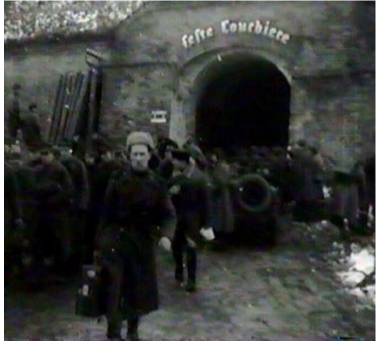
Cytadela. Kadry z filmu o wyzwoleniu Grudziądza. Domena publiczna.

Miasto jest zniszczone w około 60 procentach.