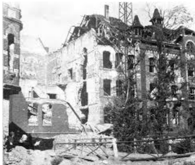
Zniszczenia wojenne.

Miasto jest zniszczone w około 60 procentach.