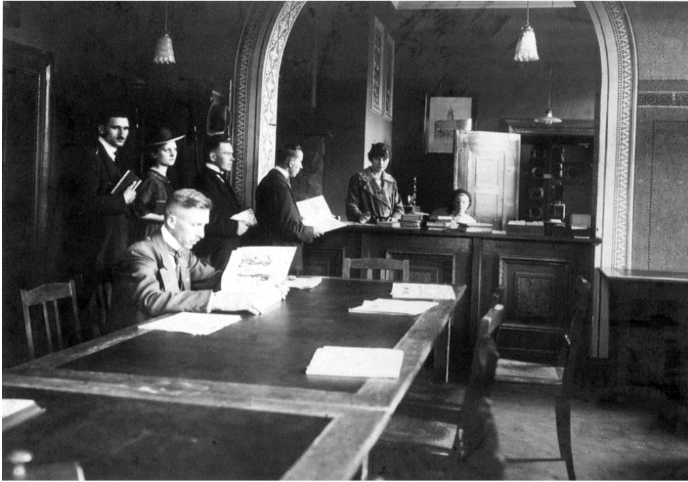
Czytelnia TCL w gmachu biblioteki przy ulicy Lipowej 28.

Rozdział trzeci, najobszerniejszy, omawia wszystkie formy działalności Towarzystwa w latach 1921-1939. Zawiera informacje dotyczące powiatowych i miejskich struktur TCL, Sekretariatu okręgowego na Pomorze wraz ze składnicą i wypożyczalnią przezroczy, księgozbioru i zasad funkcjonowania biblioteki głównej i filii, aktywności kulturalno-oświatowej oraz sytuacji finansowej.