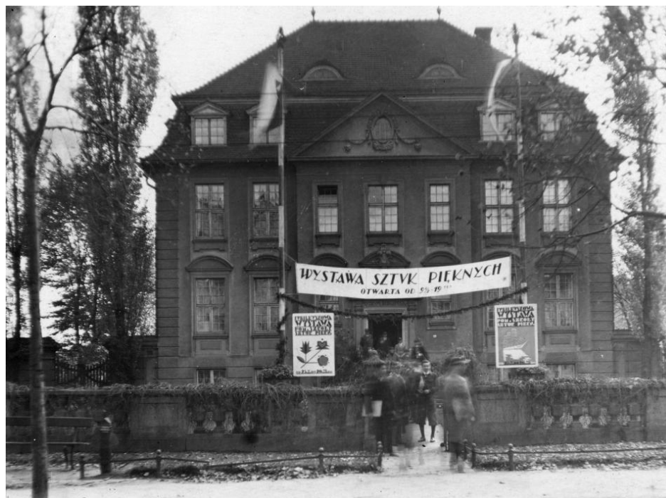
Gmach biblioteki i muzeum przystrojony na wystawę z okazji 10-lecia Pomorskiej Szkoły Sztuk Pięknych w 1932 r.

Współczesna biblioteka jest kontynuatorką przedwojennych tradycji biblioteki TCL. Biblioteka Miejska im. Wiktora Kulerskiego stara się być aktywnym uczestnikiem życia kulturalnego w mieście, dostosowywać swoje usługi do potrzeb współczesnego czytelnika, zapewnić powszechny dostęp do zasobów kultury i nauki. Swoimi działaniami wspiera budowanie społeczeństwa obywatelskiego i dba o zachowanie lokalnej tożsamości kulturowej.