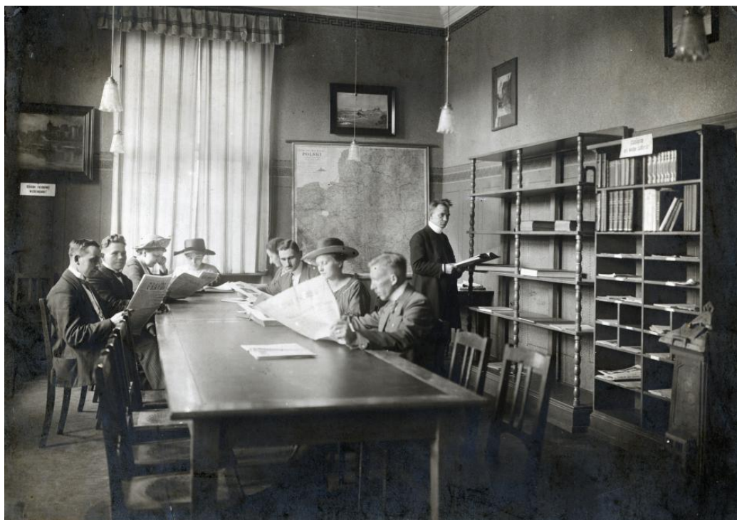
Czytelnia TCL w gmachu biblioteki przy ulicy Lipowej 28.

Współczesna biblioteka jest kontynuatorką przedwojennych tradycji biblioteki TCL. Biblioteka Miejska im. Wiktora Kulerskiego stara się być aktywnym uczestnikiem życia kulturalnego w mieście, dostosowywać swoje usługi do potrzeb współczesnego czytelnika, zapewnić powszechny dostęp do zasobów kultury i nauki. Swoimi działaniami wspiera budowanie społeczeństwa obywatelskiego i dba o zachowanie lokalnej tożsamości kulturowej.