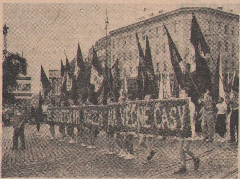
Na zakończenie Kongresu Związku Młodzieży Czechosłowackiej w Pradze odbyła się wspaniała defilada młodzieży w liczbie ponad 100.000, która przemarszerowała przed premierem Zapotockym. Na zdjęciu: Fragment pochodu. Napis brzmi: „Ze Związkiem Radzieckim — po wieczne czasy”.