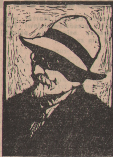
WYCZÓLKOWSKI — autoportret.

W ostatnich latach życia. Dlatego też Kuratorium postanowiło wysłać do Ministerstwa Kultury i Sztuki ażeby uroczystości związane z setną rocznicą urodzin wielkiego polskiego grafika miały charakter ogólnopolski z uwzględnieniem Bydgoszczy jako ich centrum.