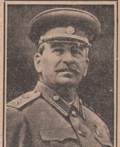
W DNIU DZISIEJSZYM MIJA PIĄTA ROCZNICA NADANIA TYTUŁU GENERALISSIMUSA ZSRR WODZOWI NIEZWYCIĘ- ZONEJ ARMII RADZIECKIEJ, WIELKIEMU STRATEGOWI I ORGANIZATOROWI RADZIE- CICH SIŁ ZBROJNYCH JÓZEFO- WI STALINOWI.

Przedstawiciel Zw. Radzieckiego wykazuje brak uzasadnienia w sprze- ciwach zachodnich władz okupacyj- nych odnośnie utworzenia komisji przygotawczej do wyborów skła-