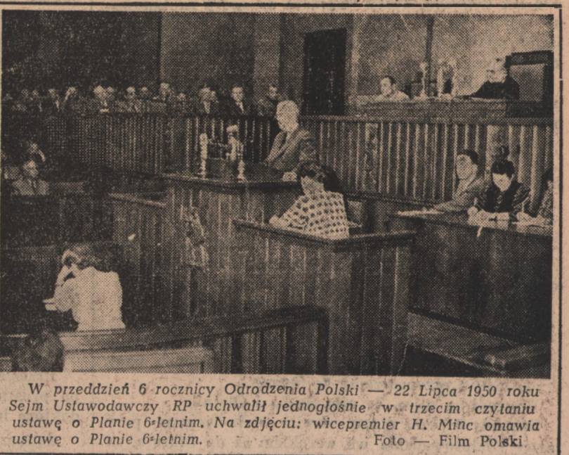
W przeddzień 6-rocznicy Odrodzenia Polski — 22 Lipca 1950 roku Sejm Ustawodawczy RP uchwaślił jednomyślnie w trzecim czytaniu ustawę o Planie 6-letnim. Na zdjęciu: wicepremier H. Minc omawia ustawę o Planie 6-letnim.

Na ręce premiera Cyrankiewicza wpłynęły depesze od Wylko-Czerwenkowa — premiera Bułgarskiej Republiki Ludowej, Orla Grotewohla — premiera N. R. D. Matyasa Rakosi — wicepremiera Węgierskiej Republiki Ludowej, dr Petru Grozy, premiera Ludowej Republiki Rumuńskiej i Kim Ir Sena — premiera Koreańskiej Republiki Ludowo-Demokratycznej.