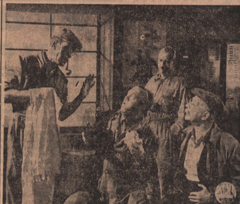
Na ekrany kin krajowych wchodzi nowy film polskiej produkcji „Dwie brygady”...