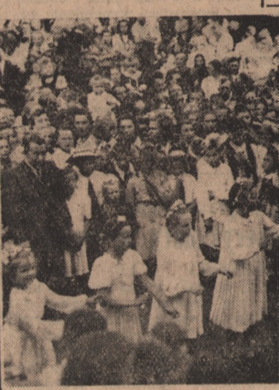
W ub. niedzielę obchodzono uroczystość w woj. warszawskim tradycyjne dożynki. Szczególnie w tym roku, w pierwszym roku Planu 6-letniego, uroczystości zakończyła akcja zniwnej miały podniosły charakter. Akcja przebiegała sprawnie i płony były obfite. Na zdjęciu: Uroczystości dożynkowe w Jabłonie k. Warszawy. Występy dzieci szkolnych we wsi Piekietko. 8