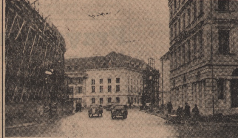
Nowa Warszawa, stolica socjalistycznej przyszłości odbudowuje się i rozbudowuje w polskim tempie. Obok zrekonstruowanych gmachów zabytkowych powstają jak grzyby po deszczu nowe piękne budowle.