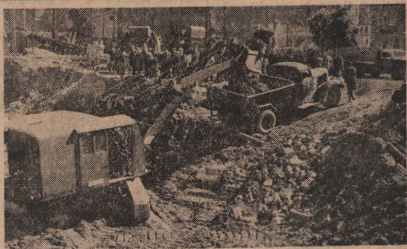
Budowa Marszałkowskiej Dzielnicy Mieszkaniowej w Warszawie posuwa się szybko naprzód. W nie długim czasie staną już pierwsze mury. W tej chwili kopie się rowy pod podmurówkę przyszłych domów dla świata pracy. Największe natężenie robót daje się zauważyć na odcinku między Piękną a placem Zbawiciela. Na zdjęciu: Fragment prac.