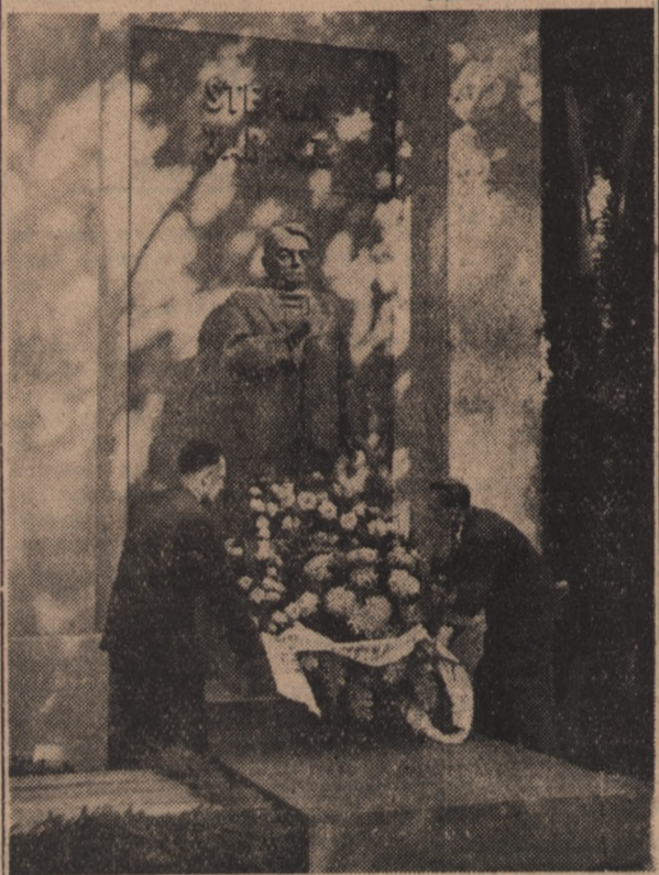
W piątą rocznicę śmierci Stefana Jaracza został odsłonięty w Alei Zasłużonych na cmentarzu powązkowskim w Warszawie pomnik ku czci tego wielkiego artysty. Na zdjęciu — Delegacje świąta artystycznego i społeczeństwa warszawskiego składają wieńce pod nowo odsłoniętym pomnikiem.