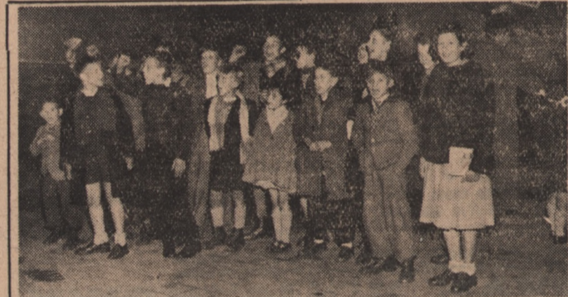
W czasie wielkiego strajku górników francuskich w Auchel, Zn. Zaw. Górników zaprosił na wypoczynek do Polski dzieci strajkujących, pragnąc w ten sposób dać wyraz solidarności z walczącymi o swe prawa towarzyszami pracy. Dzieci górników z Auchel przybyły 19 bm. do Warszawy.

Zebrani wśród hucznych oklasków na cześć Józefa Stalina — postanowili wysłać depeszę, w której zapewniają genialnego wodza mas pracujących o niezłomnej woli walki o szczęście ludzkości, o pokój i postęp.